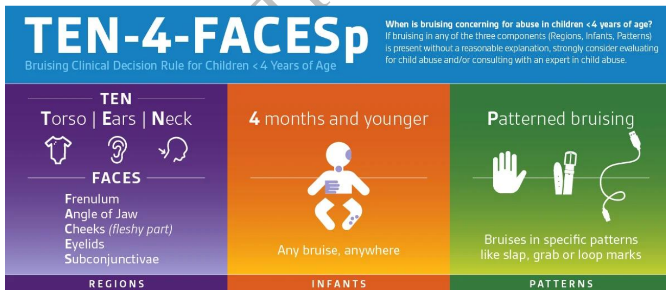
Figur 5. TEN-4-FACES-p er et screeningsværktøj til vurdering af mærker hos børn <4 år ift. mulig fysisk overgreb. TEN-4-FACES-p har en sensitivitet på 96 % og specificitet på 87 %.

AHT forekommer oftere blandt drenge, ved ung mor, sen svangrekontrol, lav fødselsvægt, præmaturitet og flerfoldsgraviditet; overgrebspersonen er oftest en mandlig omsorgsperson. SDH, ødemer og SAH er i et dansk studie beskrevet som karakteristika ved fatal AHT.