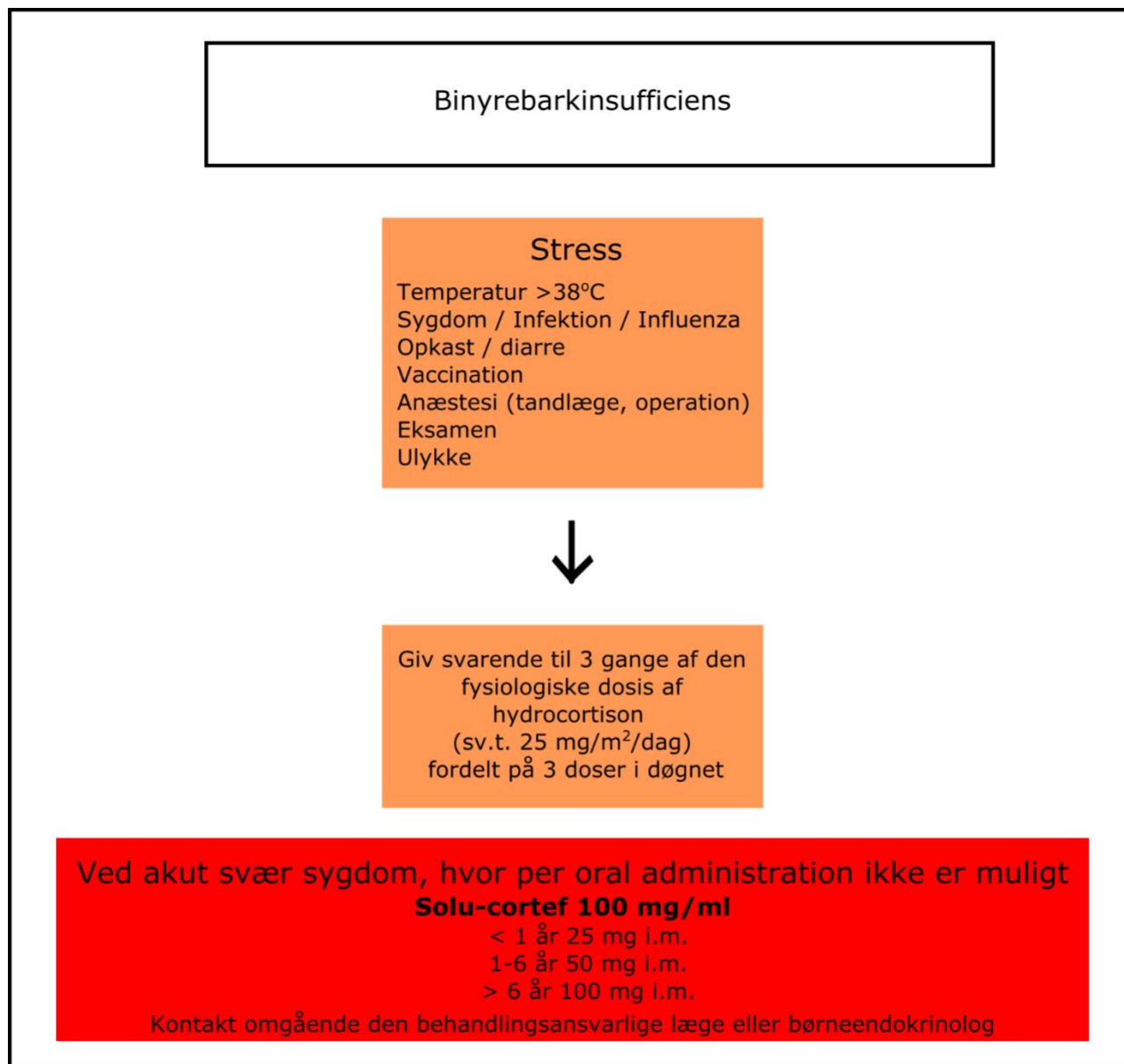
Figur 2: Stressdosering ved binyrebarkinsufficiens. Se Tabel 1 for ækvivalente doser for omregning til andre præparater.

NB. Hos børn, der får glukokortikoid svarende til hydrocortison >25 mg/m 2 /dag (eller tilsvarende ækvivalent dosering), skal doseringen ikke øges under stress.